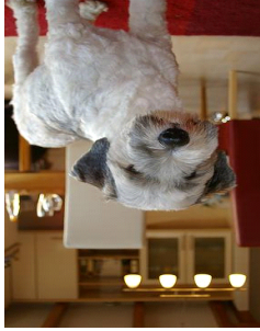
Alter: ca. 15 Jahre