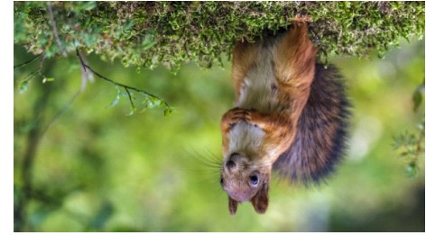
Eichhörnchen (Sciurus vulgaris)