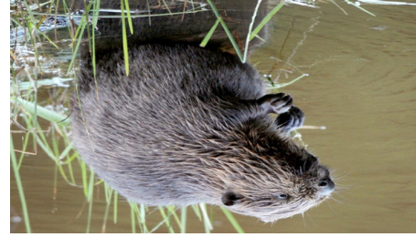
Bismarratte (Ondatra zibethicus)