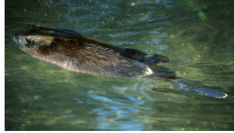
Biber (Castor fiber)