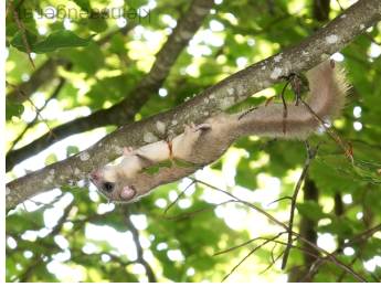
Siebenschläfer (Glis glis)