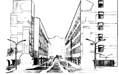
Ein Architekturquiz von Alle Wulf (Klasse 11)