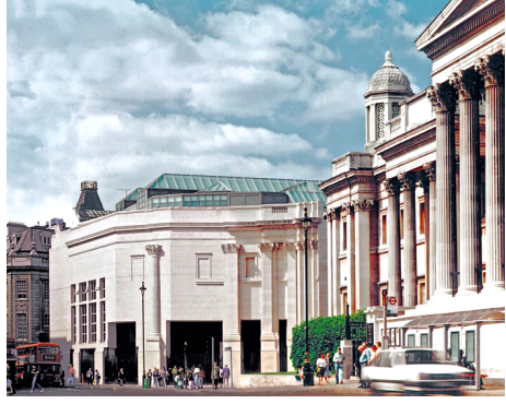
BU3: Sainsbury Flügel der National Gallery in London