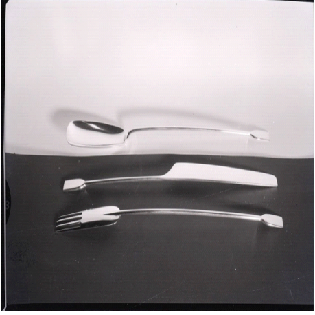
BU3: Elegantes Design in vielen Bereichen steht für seinen internationalen Ruhm (Foto: Paolo Monti ) https://deu.archinform.net/arch/244.htm