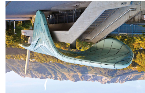
BU1: Station Löwenhaus