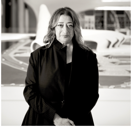
BU3: Zaha Hadid vor dem Modell des Heydar-Aliyev-Zentrums in Baku, 2013