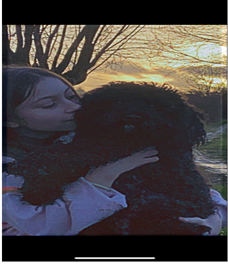
Mon chien basile met toujours un sourire sur mon visage avec ses câlins et son mignon visage.