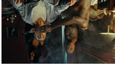
Intouchables: J'ai trouvé que c'était un film agréable et fascinant et aussi amusant. Au début, le film semblait assez ennuyeux. Mais au fur et à mesure que le film progressait, il devenait plus amusant à regarder. J'ai aussi ri très fort de certaines des choses qui se sont passées dans le film.