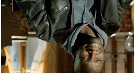
Mon personnage favori est driss. Driss est habitué à la pauvreté, ce qui rend très drôle la façon dont il gère la richesse. Ses blagues dans le film m'ont toujours fait rire. Il prend soin de Philippe mais il ose aussi tester des choses comme verser de l'eau chaude sur ses jambes paralysées. Philippe était aussi un personnage très sympa. Mais Driss m'a séduit un peu plus à cause de son sens de l'humour.