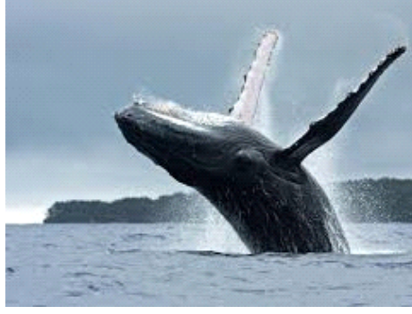
Ein springender Buckelwal