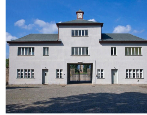
Lagertor zum "Schutzhaftslager"