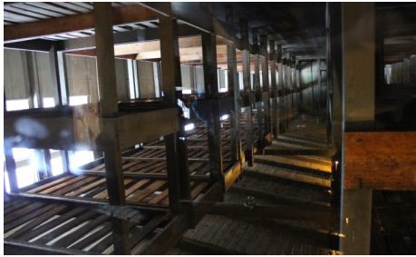
Betten der Häftlinge