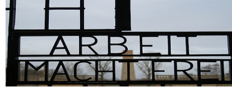
Motto der Nationalsozialisten