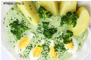
Die Grüne Soße

Das ist einen typischen Gericht aus Frankfurt. Es enthält Buttermilch, Hüttenkäse, Joghurt und Kräuter. In Varianten ist grüne Sauce in verschiedenen Ländern bekannt. In