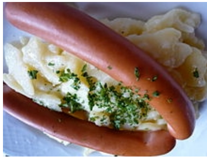
Die Frankfurter Würst

Die Frankfurter Würst ist eine dünne Würst aus Schweinefleisch im Schafendarm. Die Würst wird gemacht mit einer speziellen rauch-Methode. Die Würst soll nicht gekocht werden. Man isst sie traditionell mit Brot oder Sent.