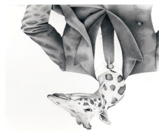
Das ist Gir die Giraffe. und Ele.