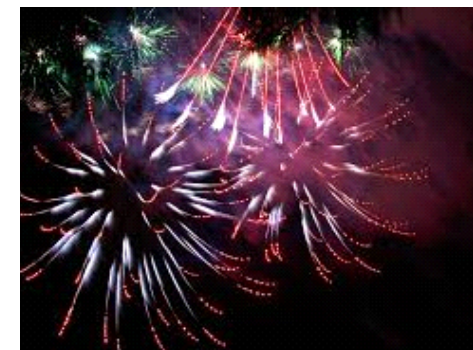
Es war am Silvesterabend.

Dieter,Conni,meine Eltern und ich sind vom 27.12.-3.1. nach Dänemark gefahren,leider ohne meine Brüder.