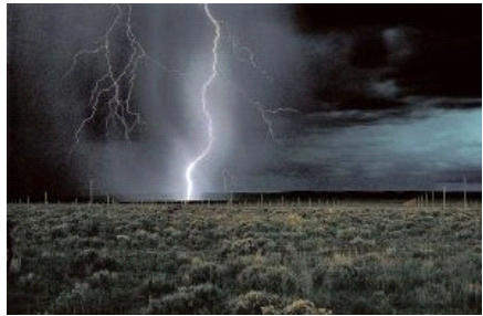
«The Lightning Field» wurde von

Besucher sind aufgefordert, so viel Zeit wie möglich im Feld zu verbringen, vor allem bei Sonnenuntergang und Sonnenaufgang. Um dies möglich zu machen, bietet die Dia Art Fondation Nachtbesuche während der Monate Mai bis Oktober an.