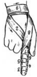
Рис. 23. Спиральная повязка на палец

Спиральная повязка на палец (рис. 23). Большинство повязок на кисть начинается с круговых закрепляющих ходов бинта в нижней трети предплечья непосредственно над запястьем. Бинт ведут косо по тылу кисти к концу пальца и, оставив кончик пальца открытым, спиральными ходами бинтуют до основания. Затем снова через тыл кисти возвращают бинт на предплечье. Бинтование заканчивают круговыми турами в нижней трети предплечья.