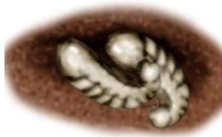
2. Die Larve

einigen Tagen schlüpft eine winzige Larve ohne Beine und Augen. Da die Larve