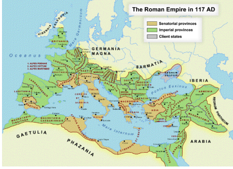
Das römische Reich im Jahr 117 4

Zur Zeit Julius Caesars erlebte das Imperium Romanum eine bemerkenswerte Expansion - doch diese fand schon seit seinem Bestehen statt.