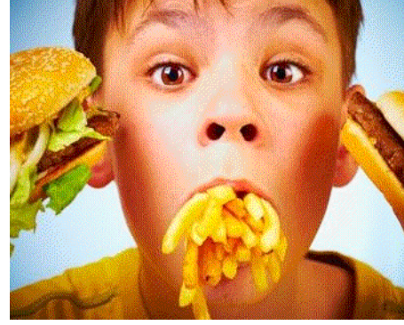
Lunch time (individuell)