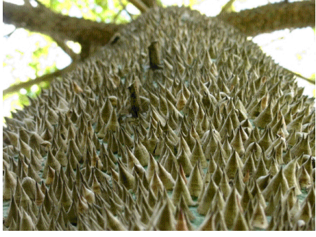
Stacheliger Stamm des Kapokbaumes ( Ceiba pentandra )

Stacheln) jene des Leids dar. In der Bildenden Kunst sind sie auch ein häufiges florales Motiv für Verletzung und Blut – siehe auch die Dornenkrone Christi.