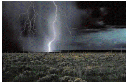
«The Lightning Field» wurde von

Besucher sind aufgefordert, so viel Zeit wie möglich im Feld zu verbringen, vor allem bei Sonnenuntergang und Sonnenaufgang. Um dies möglich zu machen, bietet die Dia Art Fondation Nachtbesuche während der Monate Mai bis Oktober an.