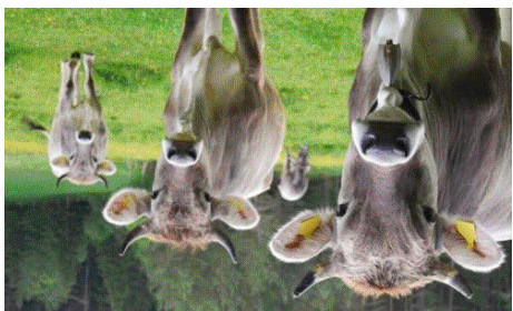
Die Kuh macht muh.